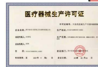
中国の医療用マスク認証