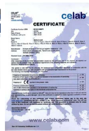
ヨーロッパの医療用マスク試験の承認書