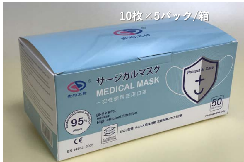
メーカーから日本へ直送の製品